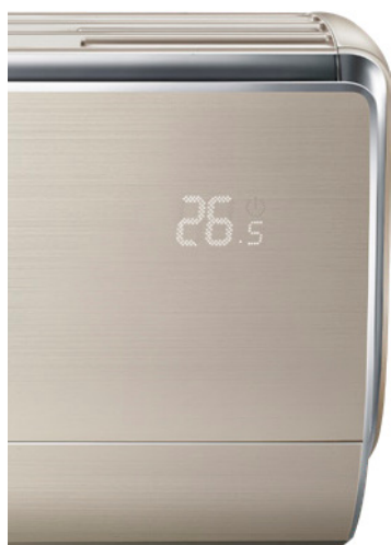
Display i front

Spenning 220-240/1/50. Begge rør må isoleres. Lydmålingene er utført i en avstand på 1 meter. Kjølekapasiteten er basert på Ute 35 °C og Rom 27 °C Varmekapasitet ved + 7°C ute.